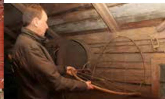
Med högågens hjälp bar man hem sitt hö.