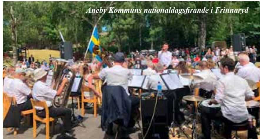
Aneby Kommuns nationaldagsfirande i Frinnaryd