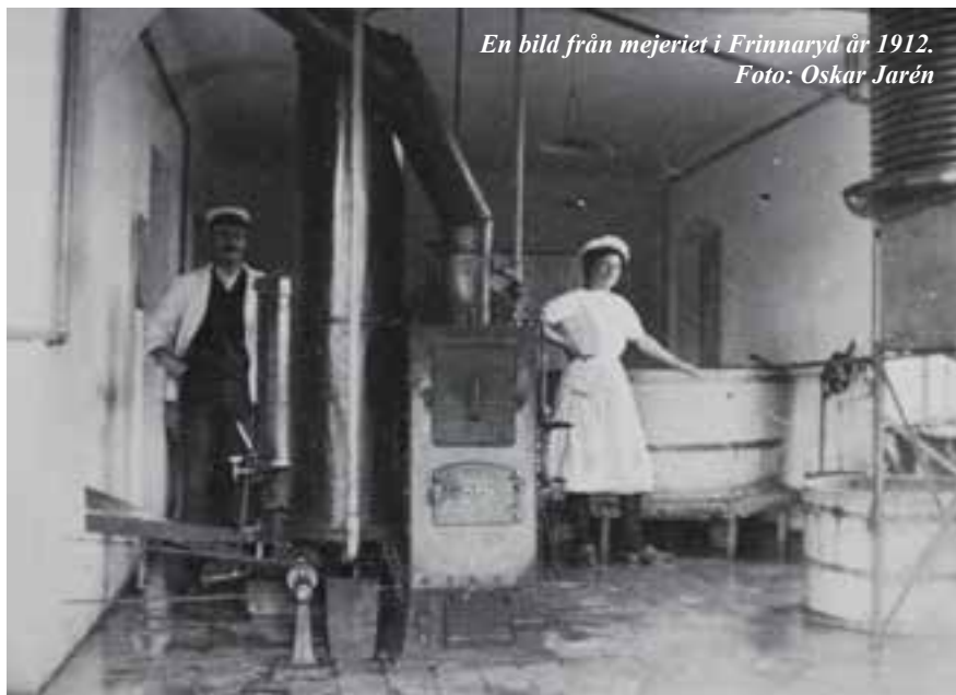
En bild från mejeriet i Frinnaryd år 1912.

Vid möte den 30 juni 1928 beslutades att utförsäljningspriset i föreningens försäljningslokal skulle vara: Helmjölk 16 öre/liter, skummjölk 5 öre/