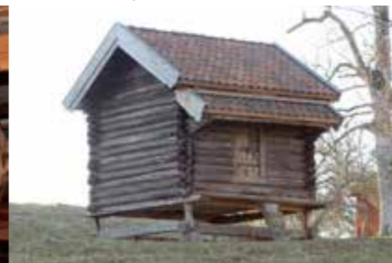
Härbret från 1500-talet.