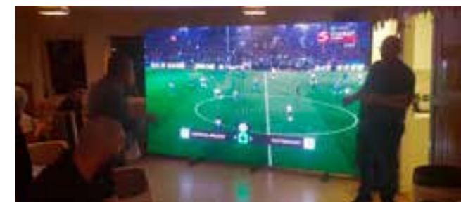
Premiere Leaguematch på TV - här finns mycket att lära!

egentligen bara väntat på rätt tillfälle att starta upp igen och så, förra hösten kändes det rätt. Intresset hade vuxit bland tidigare aktiva och nya och också hos flera nyanlända ungdomar som kommit in i spontanfotbollsgänget.