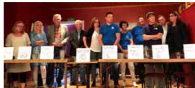
Partiledardebatt inför kommunal- och riksdagsvalet 2018