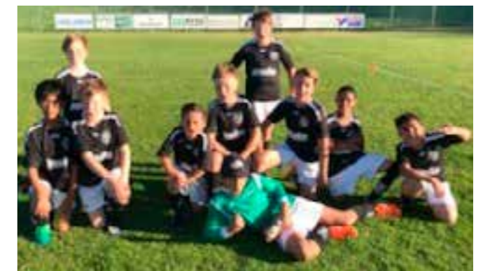
P06-laget pustar ut efter en match. Det var en varm fotbollssommar.