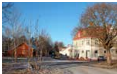
Åbrovägen. Fritzells fastighet är det grå huset till höger.

punkt vid Fritzells fastighet Särila vid Stationsvägen 5, det som idag är Åbrovägen. Den var i äldre tid en del av den gamla häradsvägen västerut mot gamla bron över Svartån. Före järnvägens tillkomst 1874 gick vägen i en tänkt rak linje från Fritzells fastighet österut (över nuvarande bangård) och mötte dagens Docklidsvägen/Dockelia, där den nu rivna stora och folkrika fastigheten Haga låg. Tyvärr finns inte Haga kvar, det är ledsamt av flera anledningar, men det får vi återkomma till vid ett annat tillfälle.