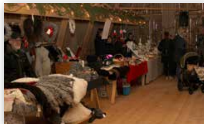
Välfyllda marknadsstånd. Jan-Olof Wennberg med sina fårplådar.