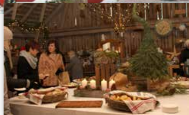
Serveringsbordet var välbesökt.