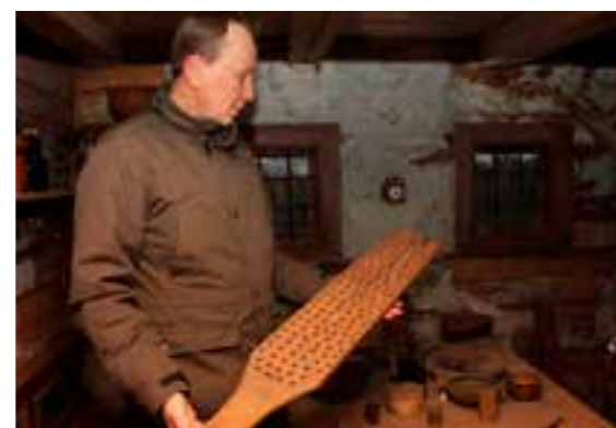
Lusbrädan – årets julklapp för 200 år sedan?