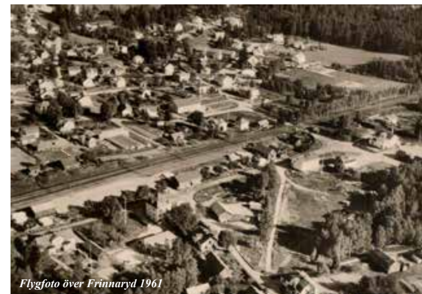
Flygfoto över Frinnaryd 1961