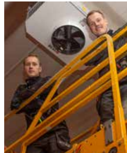
Fläktmontering i Thorebrings nya lagerlokal i Aneby.