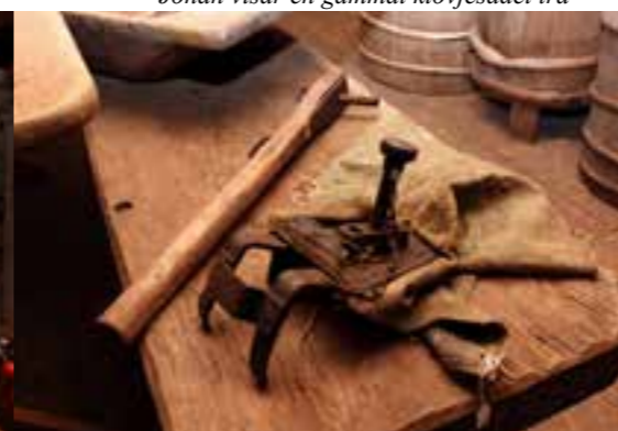
Den gamla slaktmasken