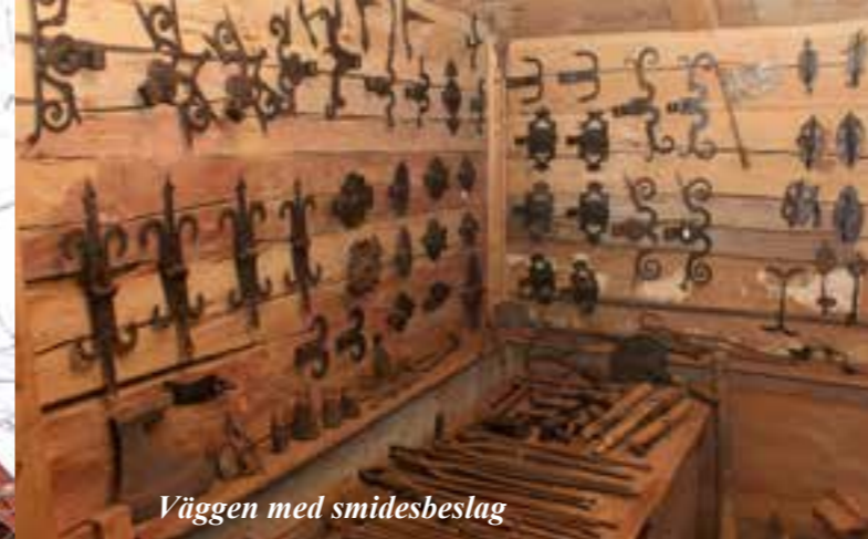
Väggen med smidesbeslag