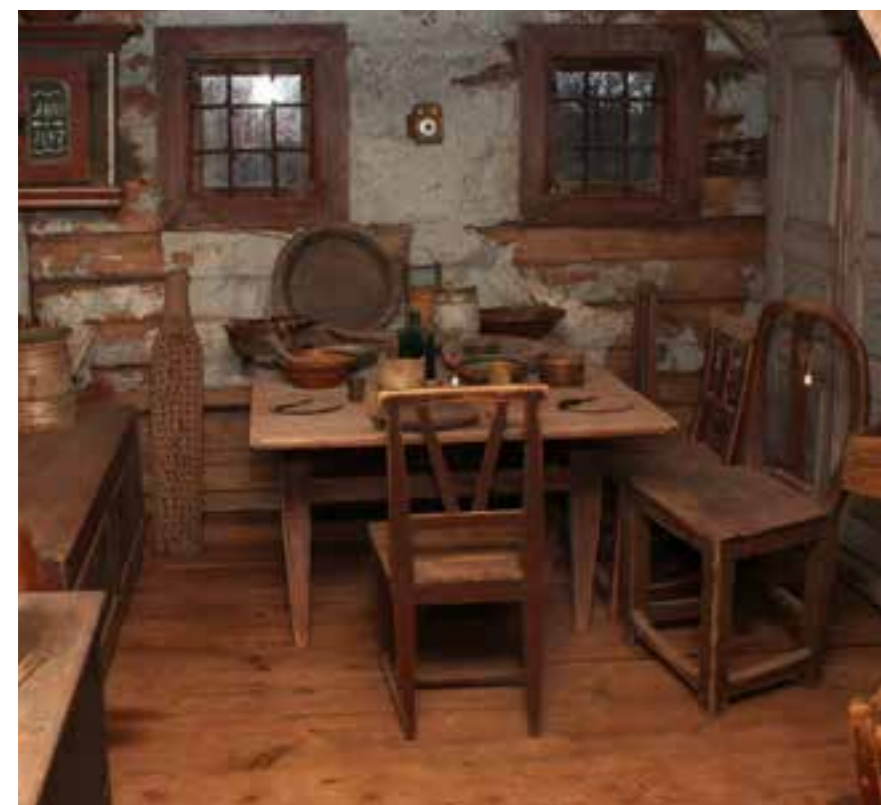
Så här kunde ett gammalt lantkök ha sett ut i början av förra seklet.

Snickaravdelningen är fylld med gammaldags snickarverktyg. Hyvlar, klubbor, borrar och andra verktyg ligger prydligt upprada-